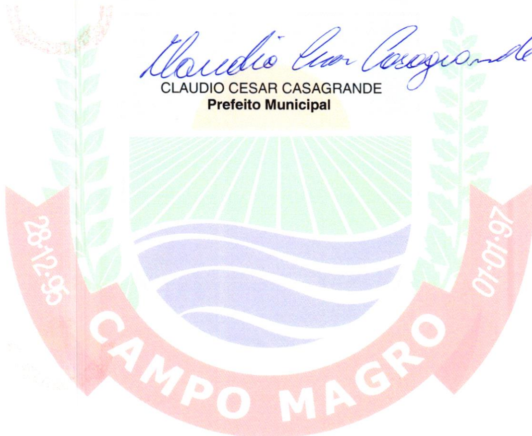
CLAUDIO CESAR CASAGRANDE Prefeito Municipal