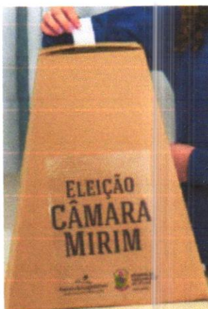
Modelo de Urna enviada pela SEMEC.

OBS: Digitar o nome completo de todos os alunos e assinalar os faltosos.